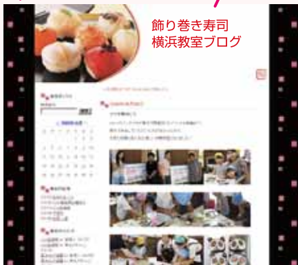
飾り巻き寿司 横浜教室ブログ